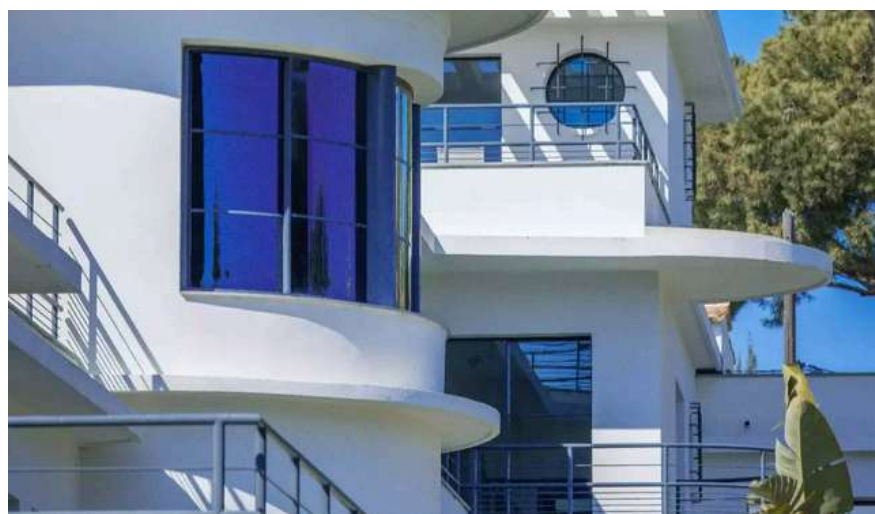
La villa Mayflower, un paquebot face à la mer