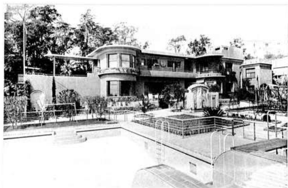
Villa Mayflower, autrefois Casa Nueva, en 1936