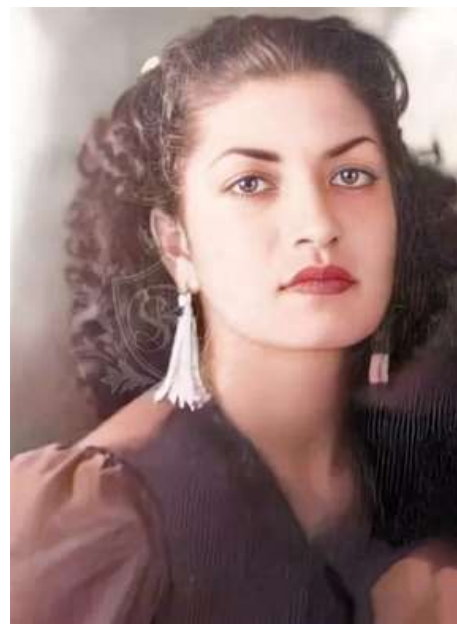
La princesse Ashraf Pahlavi (1919-2016), sœur jumelle du shah d'Iran

En 2021, après d'importants travaux de rénovation, la villa retrouve toute sa splendeur d'antan.