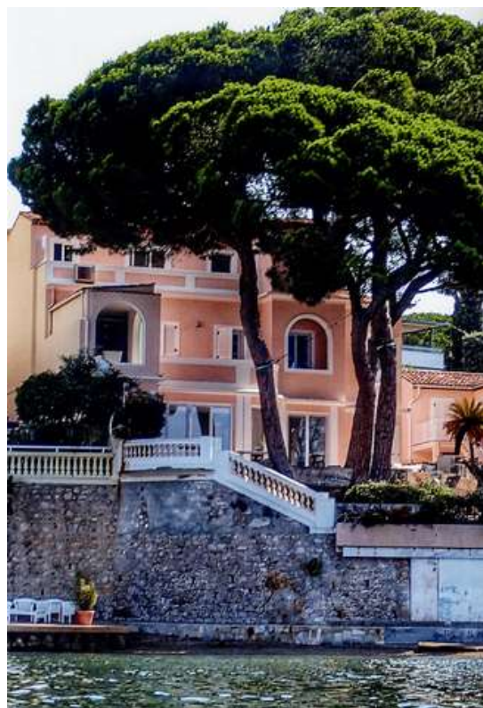
La villa Sud, vue depuis la mer